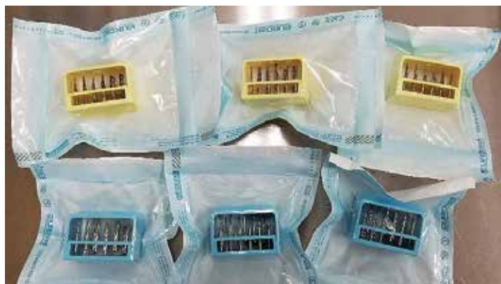
ダイヤモンドバー

患者様の口腔内を乾燥する為に用いるスリーウェイシリンジの先端など、患者様ごとに交換しています。