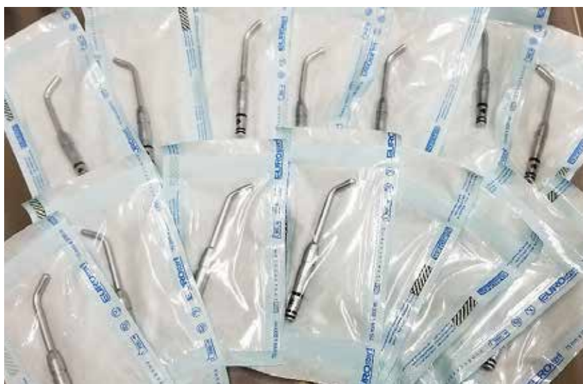
スリーウェイシリンジの先端

患者様の口腔内を乾燥する為に用いるスリーウェイシリンジの先端など、患者様ごとに交換しています。